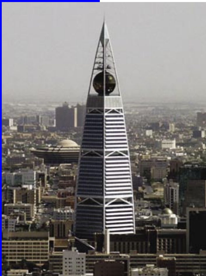
Picture: Riyadh, capital of Saudi Arabia