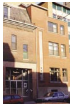
1857, de Maisonneuve O. Montréal. 514-937-5351

Le Catholic Community Services n'est pas une nouvelle organisation, il existe en fait depuis plus de 70 ans et commençait à offrir ses services sous le nom de bureau d'aide sociale catholique, dans les années 30. Ses buts et objectifs sont sympathiques et incluent le bien-être des personnes vivant avec le SIDA.