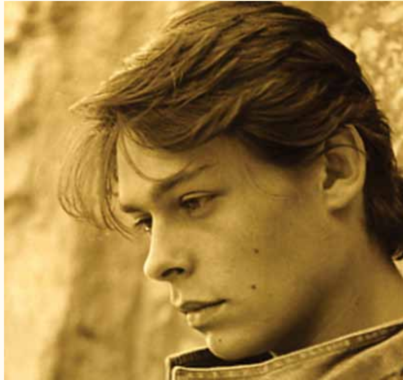
Publié avec l'aimable autorisation de l'auteure et de Gilles Schaufelberger

Publication exclusive du premier livre de Caroline Gréco portant sur l'annonce de l'homosexualité d'un jeune à ses parents.