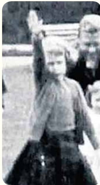
Photo: La princesse Élisabeth en 1933 imitant un salut romain ou nazi?

C'est que le journal The Sun a diffusé sur son site Web un vidéo de la jeune princesse Élisabeth, devenue reine d'Angleterre des années plus tard, la montrant en train de faire ce que l'on prétend être un salut nazi. Toute une affirmation qui aurait dû être vérifiée avant d'être publiée, car elle pourrait coûter très cher à l'éditeur... Voici pourquoi... Cette photo date de 1933, or il est important de savoir que même si elle imitait le nouveau chef de gouvernement allemand Adolph Hitler, qui venait à peine d'être élu, ce salut est loin d'avoir la signification qu'il a eu bien des années plus tard. En effet, alors que la jeune princesse semblait s'amuser à saluer à la «romaine» ou à la «hitlérienne», c'était tout de même 6 ans avant le début de la Deuxième Guerre mondiale et 12 ans